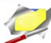
125 g beurre